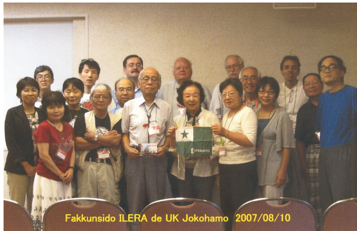
92a UKE en Jokohamo, Japanio